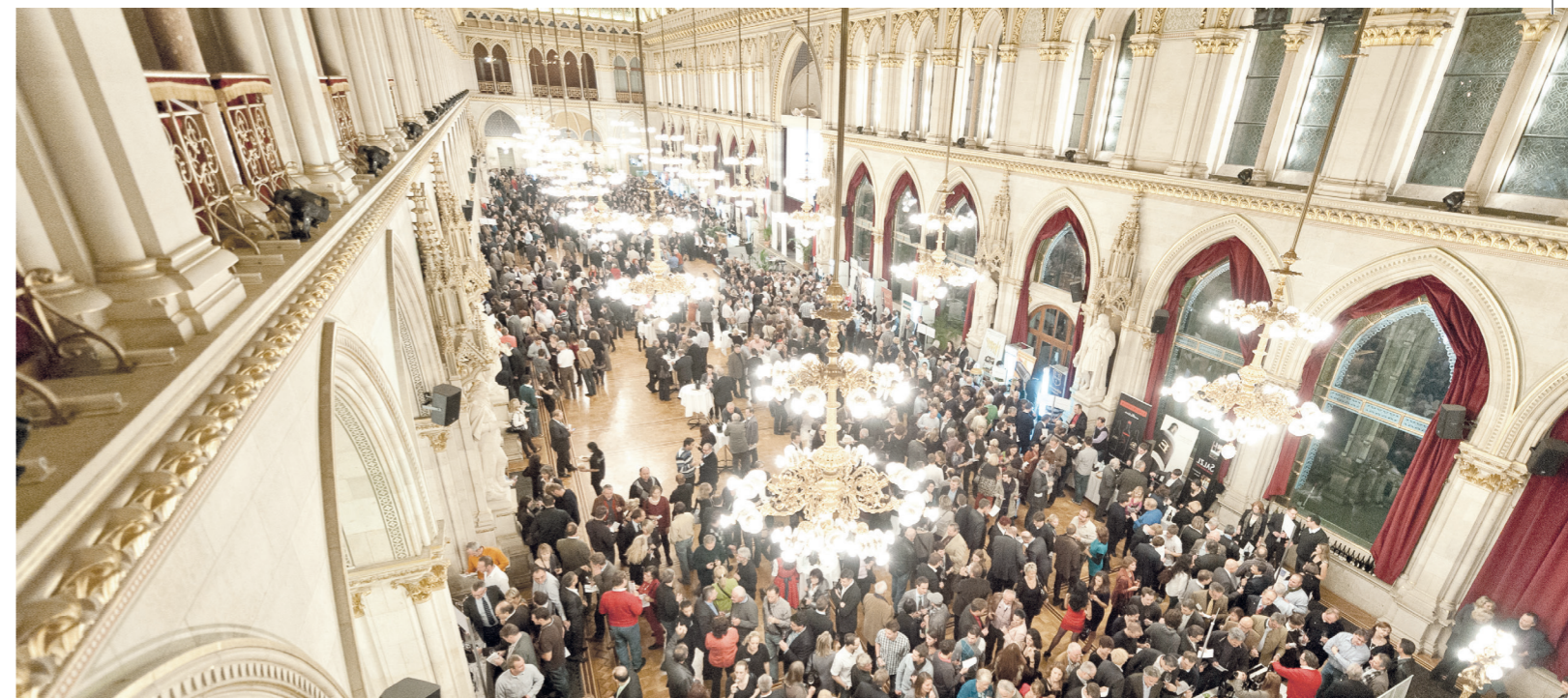
awc vienna Gala Nacht - die Besten der Besten | awc vienna Gala Night - just the best