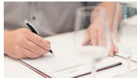
Kompromisslose Fairness | uncompromising fairness