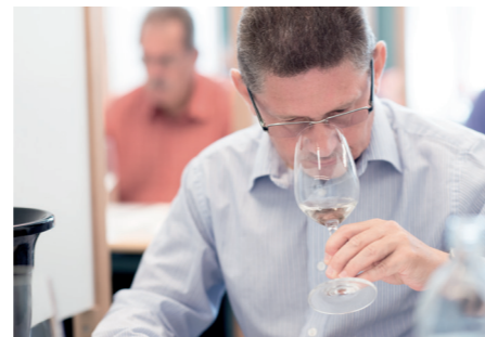
Größtmögliche Objektivität maximum objectiveness