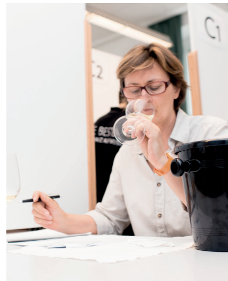
Blind-Verkostung - das ist einzigartig bei dieser Größe blind-tasting - worldwide unique