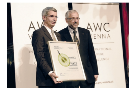
Gala Nacht des Weines / Wine Gala Night